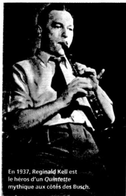
En 1937, Reginald Kell est le héros d'un Quintette mythique aux côtés des Busch.