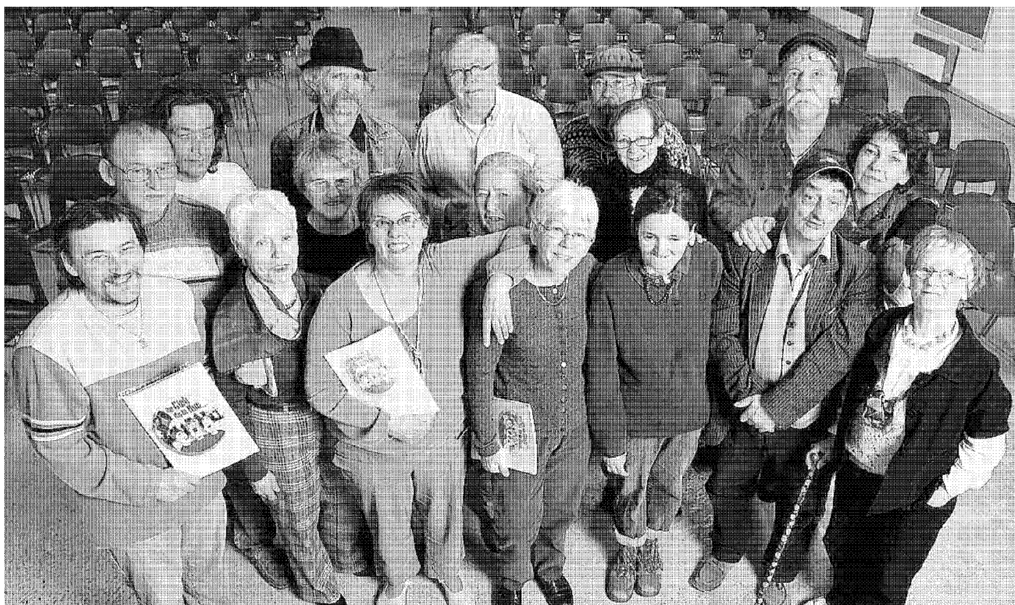
Au Clair de la rue est une chorale composée de gens issus de la rue et de bénévoles. Elle a fait l'objet d'un documentaire de 52 minutes, réalisé par François Bontemps. Renseignements : www.expertic.fr